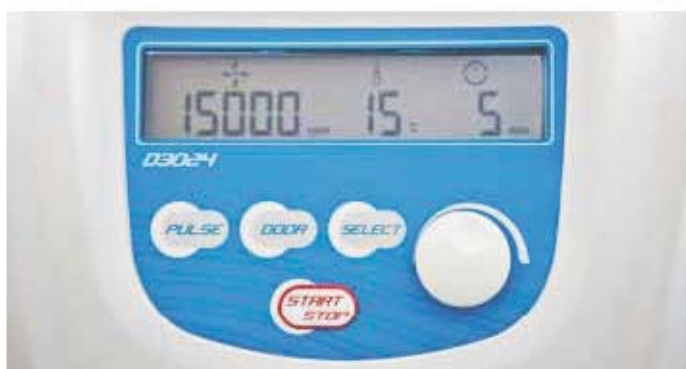
Display D3024 - D3024R